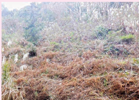
▲荒廃し、耕作ができなくなった農地

については、耕作を行わない農地においても、除草などの適切な管理を行い、皆が気持ちよく農作業に取り組めるように努めましょう。