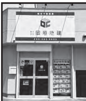
海老津バスのりば横