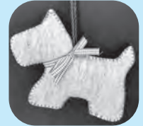
▲フェルトで作ったマスコット

※イベントの詳細い内容はこども未来館または町公式ホームページにある「こどもみらいかんメール」を見てください。