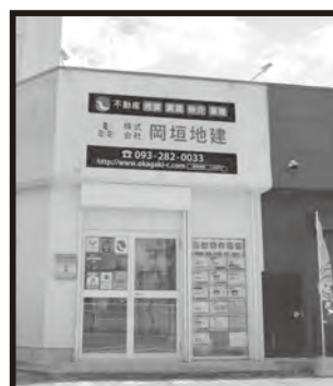
海老津バスのりば横