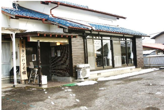
↑東高倉区公民館「ふれあい館」は区民の憩いの場所です

東高倉区は町の中央部に位置する、閑静な住宅街です。国道3号線や海老津駅へのアクセスも良く、近隣には役場やスーパーマーケット、病院もあるなど、暮らしやすい環境が整っています。お年寄りから子どもまで幅広い世代が暮らす東高倉区では、区の活動を通して、地域交流、世代間交流を深め、住みよいまちづくりに取り組んでいます。