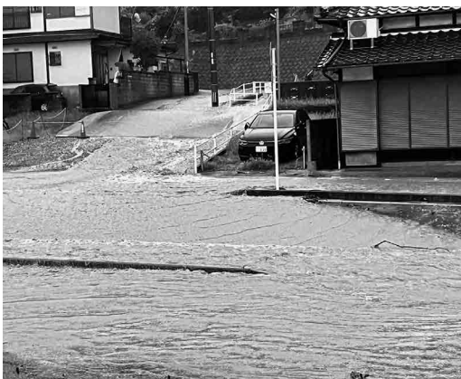
8月豪雨（上海老津区）

町長 今回の大雨対応での課題を整理していくなかで、町道の通行止め箇所の周知に課題があったので新たに地図情報をホームページで掲載し分かりや