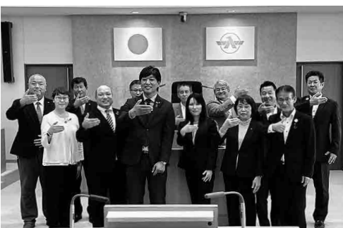
津幡町議会の皆さんと（手の形は能登半島）