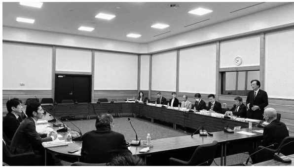
上三川町での視察研修