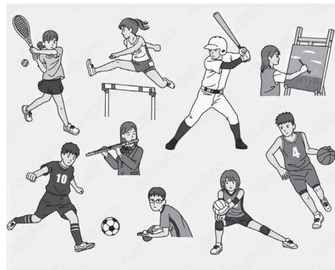
充実した部活動を

取り組みをなされていますか。 教育長 国の地域移行に関する最終とりまとめでは、部活動指導員の導入に対する安定的な財源確保も課題となりました。今後、部活動地域展開に伴う国や県等の費用負担についても国から詳細が示される予定です。 保護者や児童生徒が不安を抱えていることは承知しています。町の方向性を示すことができるようになった段階で、適切に部活動の参加について判断していただけるように、適時情報提供していきます。