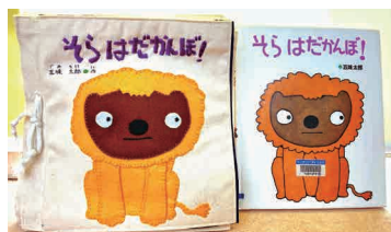
そらはだかんぼ！ 作・五味 太郎 偕成社

A 布絵本は、元になる紙の絵本に合わせて、大きさや色、形などをできるだけ忠実に再現しています。そのため、絵本と見比べながら布や糸の微妙な色合いを選ぶ作業には特に時間と工夫が必要です。また、細かな絵柄の裁断など、集中力が求められる繊細な工程も多くありますが、完成したときの達成感や、手に取って喜んでもらえることが何よりの励みになっています。