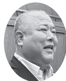
谷口 貴之 議員

谷口 8月の豪雨災害にて、町の血管である道路の問題点が、いくつか浮き彫りになったのではないかと感じます。住民の皆様への不安を払拭するためにも、早い改修整備が必要だと考えますがいかがでしょうか。