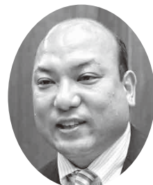
ひらやままさのり 議員 平山 正法