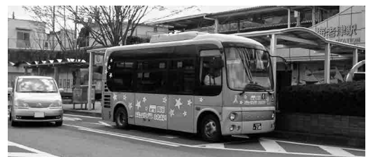
公共交通の要 コミュニティバス