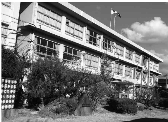
建てられて60年近くが経過した内浦小学校

町長 学校施設の更新にあたっては、教育委員会と関係課で検討委員会を設置、教育的観点だけではなく、地域コミュニティ・防災機能等も合わせ検討を開始した段階です。複式学級は良い点も課題もあるため、それだけを理由としての再編はありません。