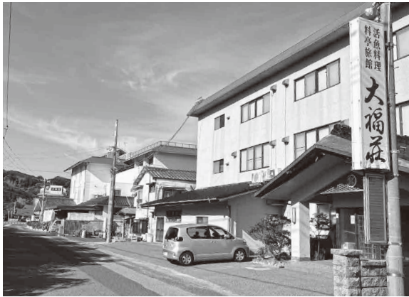
高付加価値化事業が採択された旅館街

町長 限られた財源の中で、全ての国や県の補助事業に対して補助金を上乘せすることは困難であり、事業を選択し、効果的に支援していくことが重要と考えます。本町における公益性や必要性などの度合いを十分に見極めなが