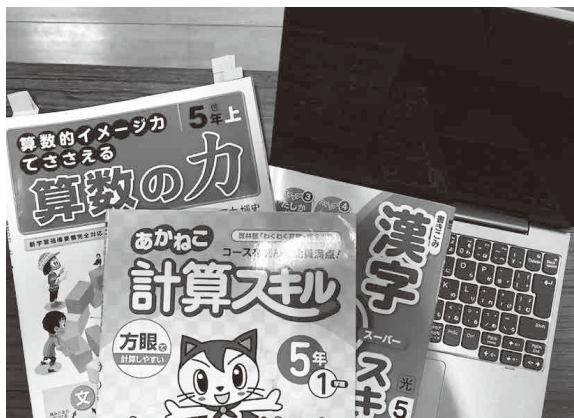
わかると楽しいよね！

リントなどのやり取りを通して学習状況の把握や支援をしています。また、タブレット端末を活用してホットルームなどに授業の様子を配信しています。