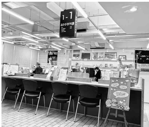
おかがきPR課で申請受付中

新型コロナウイルス感染症の影響で売上が減少した町内の法人・個人事業者に対し、支援金を給付しています。締切は令和5年2月末です。