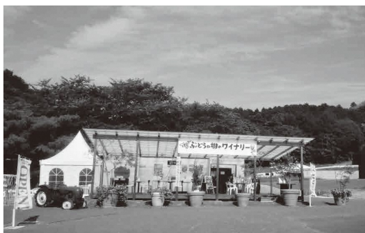
国道495号線垂水峠登り口で人気のワイナリー

市津 販売促進のため、道の駅を建設すると町が活性化するのではないですか。 町長 ワイナリーを新たな観光情報発信拠点として、今後検討していきたいと考えています。