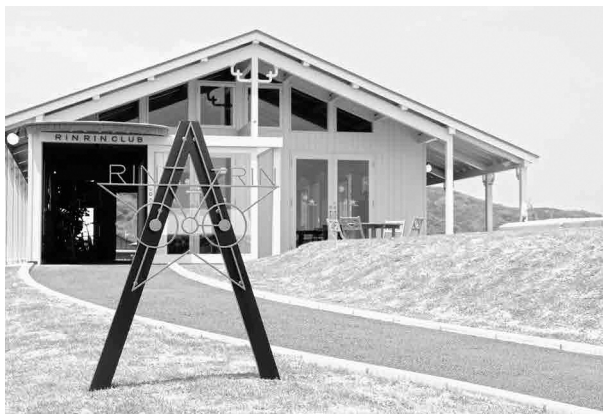
オープンしたリンリンクラブ岡垣 さらなる観光客に期待

町長 本町には、地下水を利用した特産品である本格焼酎岡垣があり、10年以上の歳月をかけて磨かれた地下水は、町の大きな魅力の一つであると捉えています。