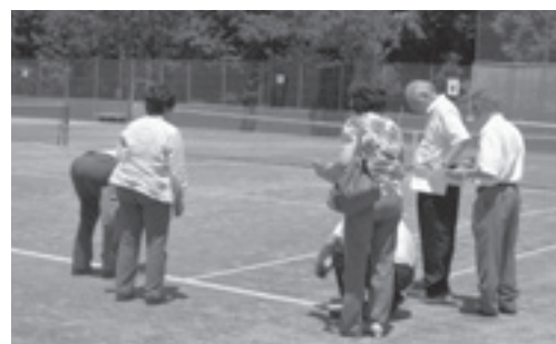
テニスコートの視察