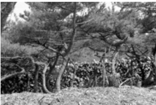
三里松原 伐倒木の状況