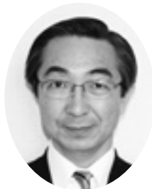
安部 弘彦 議員