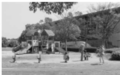
サンリーアイ公園

疾患や難聴などになる恐れがあります。肺炎による高齢者の死亡率も高くなっています。風疹や肺炎球菌ワクチン接種への助成制度を考えていくべきではないでしょうか。