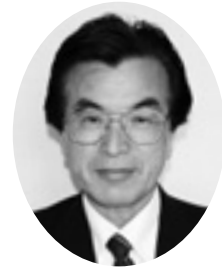
広渡 輝男 議員

広渡 JR海老津駅周辺環境プロジェクトの企業、教育、研究施設等の誘致、中心市街地活性化や、駅周辺環境整備の取り組み状況を尋ねます。