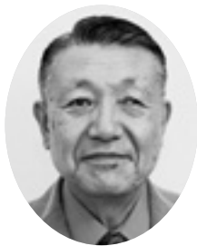
平山 弘 議員

平山 公契約で求められるのは、その事業の質の確保及び公共サービスの向上を図ることにより、住民が豊かで安心して暮らすことのできる地域社会を実現することにあると思います。いかがですか。 町長 そのとおり、公共工事の従業者の適正な労働条件を確保する制度のことと認識しています。