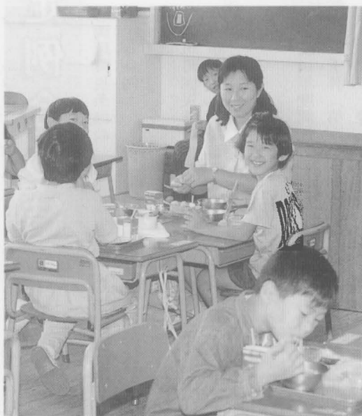
給食は元気な子を育てる