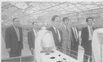
愛媛県広見町（いちご水耕栽培）

度津町農業振興会」が誕生した。一番の注目は農協の活動である。これまで農家を犠牲にして高額な機械の販売、肥料、農薬などを売りつけてきたが、将来の農協の発展との考えのもと、生産者と一体になって収益の向上が図られている。麦作協同栽培グループをつくり、8グループを結成し、発足当時三・一ヘクタールから平成14年には六十四・五ヘクタール、構成員数も全体で九十八名で主に青年層が圧倒的に多い。また大きな特徴として、非農家の方も構成員であつてもよいとのことで、農業従事者だけでなくどこに大きな特徴がある。