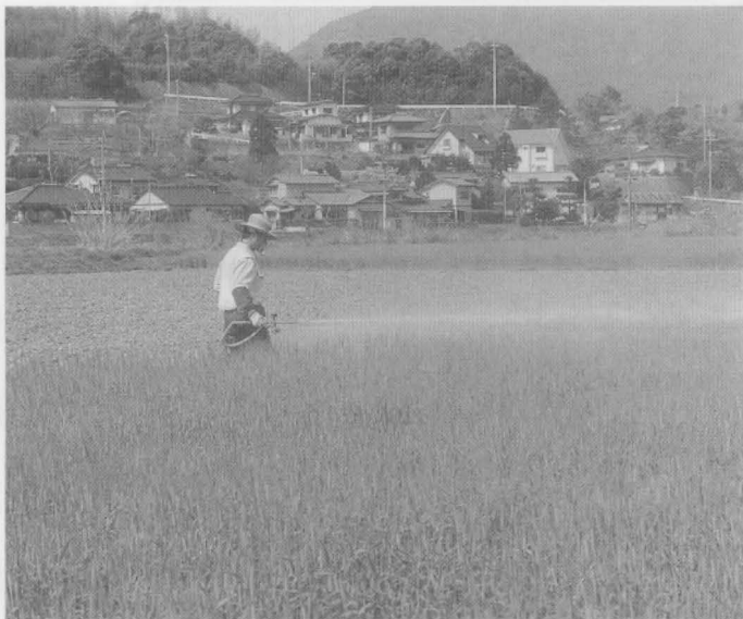
農業は厳しい状況におかれている。

問 少子高齢化での後継者不足や国の減反政策で、農業は大変な時期をむかえている。そのなかで一部の農業者は減反対策品目の大豆で農業振興を図ろうと、組合を設立され、コンバイン、トラクターを購入するために補助金申請をされている。このことについて、町は規定プラス五パーセントの上積みで予算計上されたことは高く評価するが、それ以上の上積みを検討する余地はないのか。 答 質問の主旨は理解できるが、現状ではこれが限度であり、理解してほしい。