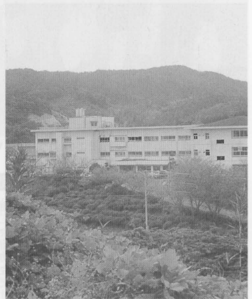
健康と学力向上にも冷暖房の設備は必要