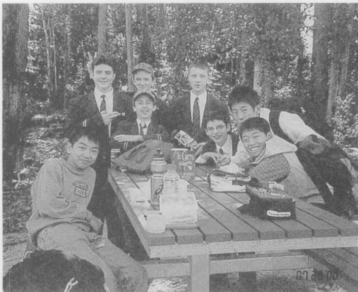
子どもは明るさが一番

子どもは明るさが一番。環境改善については校長を中心に創意工夫して対応するように指導する。