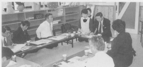
長野県松本市（子育て支援センター）

松本市には児童館・児童センターが25ヶ所あり、放課後児童健全育成事業（学童保育所と同様）も児童館で行っている。また、子育て支援事業として就園・就学前の乳幼児の遊び場としても施設を開放している。「筑摩児童センター」はキャッチフレーズとして「滑り台や積み木・絵本などの夢がいっぱい・楽しく遊んで友達をつくらう・飲食も自由・おじいちゃん、おばあちゃんもお孫さんどうぞ」としている。市民に自由に使用させる施設である。