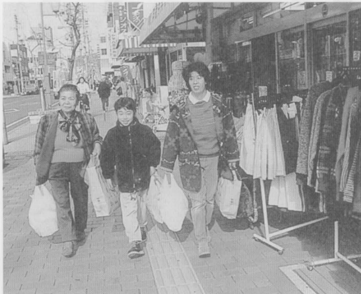
岡垣町の商店街も近い将来このような買い物姿が見られるかも