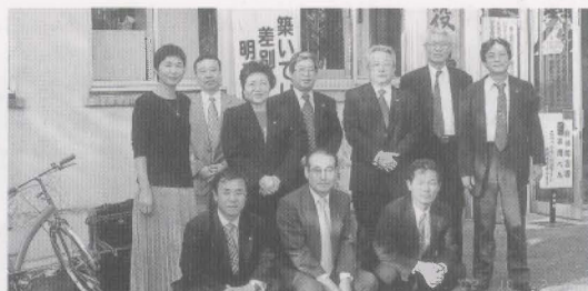
木津町・岡垣町の広報委員会委員

間違いないか読み直すことが大切であるとの指導を受けた。岡垣町の「議会だより」作成に当たっても、広報委員会で十分検討・協議を行い、町民に読まれる議会だよりを目指したいと思う。