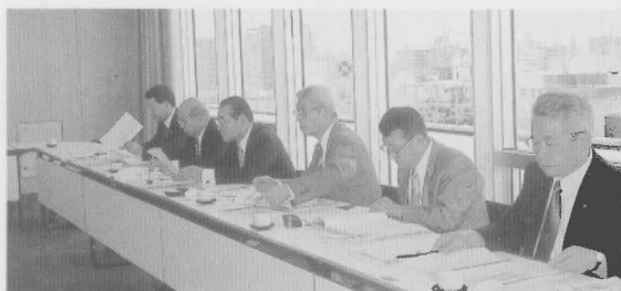
鹿児島市（男女共同参画社会について）

鹿児島県は男性が強いイメージがある。その中、昭和58年からこの問題に着手して、計画的に着実にいろいろな施策が行われており、今では先進地といわれるくらい進んでいる。市の直轄事業として位置づけ、女性課長を配し、拠点として5階建（サンエール）の素晴らしい施設で女性問題、子育て支援など積極的に取り組まれている。しかし課題も多く、社会的、経済的な問題や、家庭内の問題も多くなっ