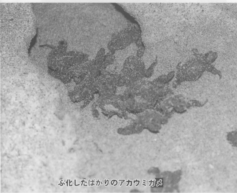
ふ化したばかりのアカウミガメ