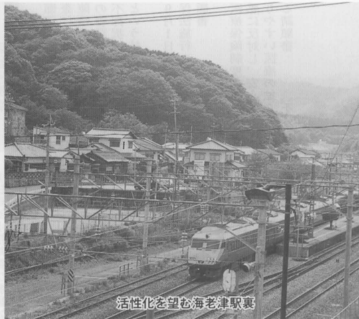
活性化を望む海老津駅裏