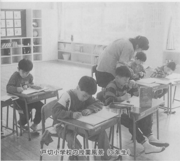
戸切小学校の授業風景 (3年生)

答弁 学校を他の場所に移すと校区の中心からずれるし経費もかさむので、やはり現在地に建てた方がいろんな面でメリットが多いと考えている。