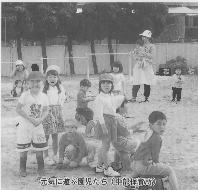
元気に遊ぶ園児たち (中部保育所)

行政区の公園通り区が新たに編成されることに伴い、給水区域に関する条文の整理が行われました。