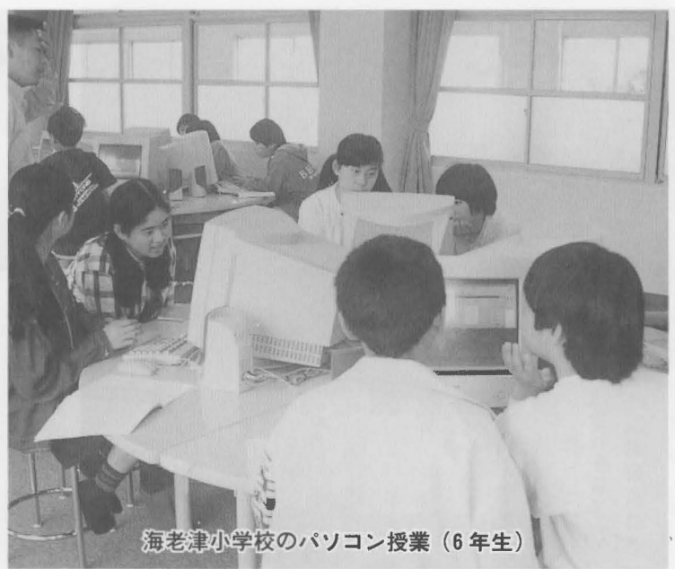
海老津小学校のパソコン授業 (6年生)

中学校では、数学、理科、社会等や選択の技術科で取り組み、基礎知識、操作等の習得の指導を行っていますが、今後は情報基礎は必須科目に、情報応用は選択科目に改められており、今後は小中学校とも指導体制