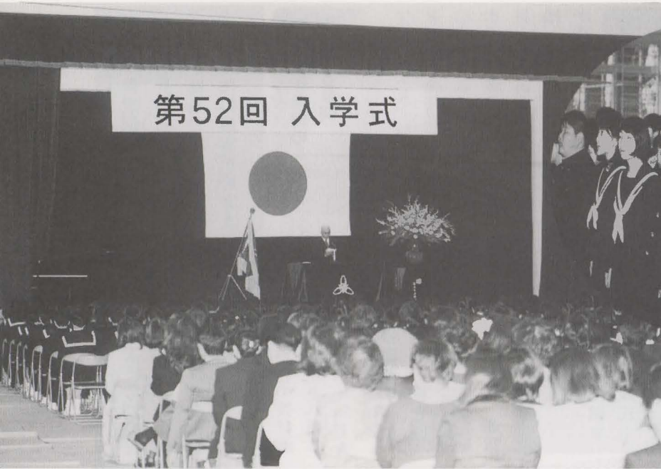
岡垣中学校入学式