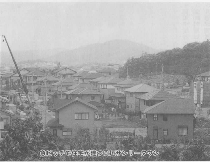
急ピッチで住宅が建つ岡垣サンリータウン

予算は、収益的収入四億七千四百六十二万九千円、支出は四億五千五百五十五万六千円です。 資本的収入八千二百萬一千元、支出は一億九千七十七万六千円が計上されました。