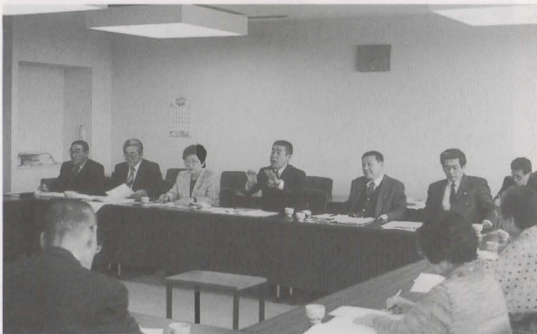
老人クラブと 議会との懇談会