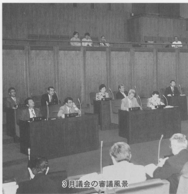
3月議会の審議風景

今後の国の保育行政の推進にあたっては、児童福祉法「改正」の趣旨及び国会の附帯決議を最大限に尊重し、国の保育予算の大幅な増額と児童福祉施設最低基準の引き上げの改訂及び、保育料が家計に見合ったものであるように配慮することを強く要望する意見書を、内閣総理大臣や関係機関に提出しました。