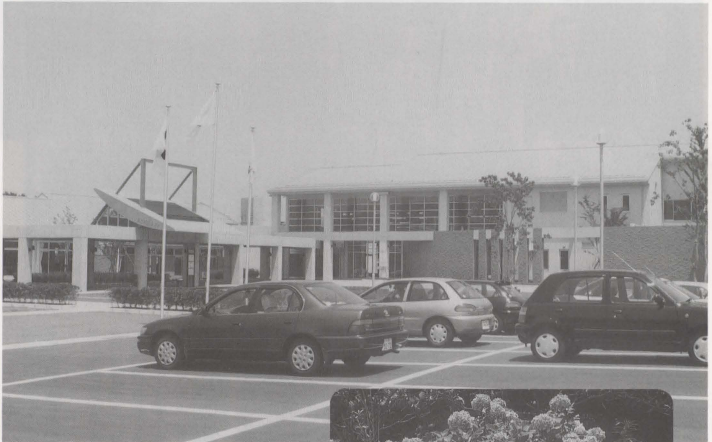
6 月にオープンした 「総合福祉保健センターいこいの里」