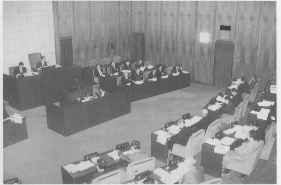
▲重要案件を審議中の議場

(賛成多数可決) 本年度の国民健康保険事業全体を表したものです。新規に町独自の事業として、国保被保険者を対象に、はり・きゅうの補助制度が導入されました。高額療養費など全体医療費が低く押さえられる見込みであり、前年度を1・5パーセント下回る二十億四千七百六十