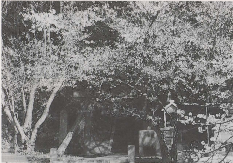
▲桜の花満開の金毘羅山

〒811-42福岡県遠賀郡岡垣町大字野間697-1 TEL (093)282-1211 FAX (093)283-3027