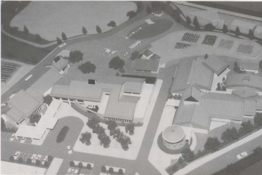
▲福祉の里完成模型(高倉)

平成6年度の最終段階の補正です。今回は歳入歳出ともに六千七百七十一万九千円を増額し、予算総額は六十八億四千四百八十三万三千円となりました。