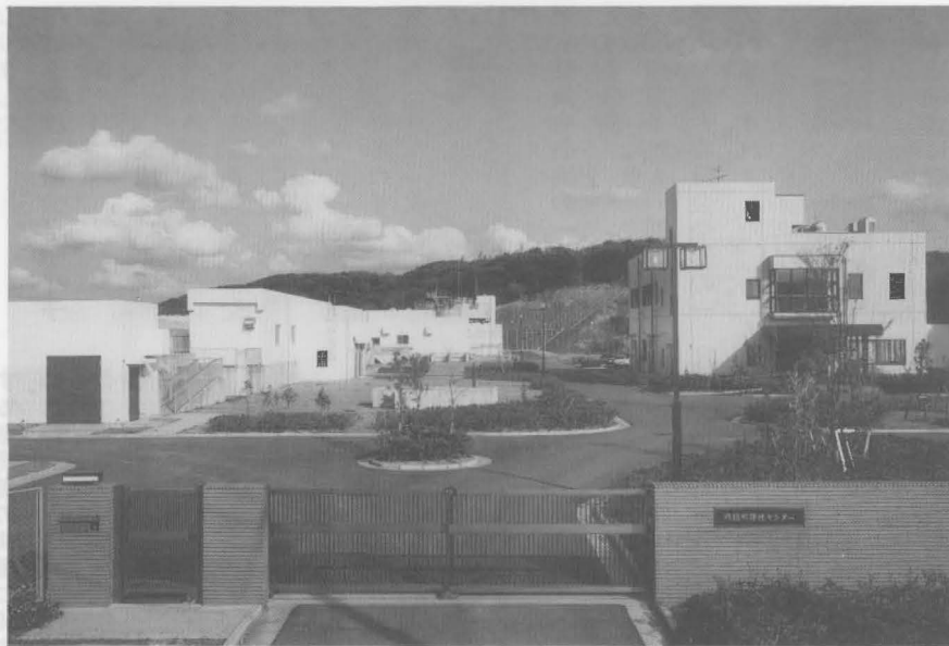
▲公共下水道の浄化センター(糠塚)

六万七千円が計上されています。 平成7年度老人保健事業特別会計予算 (賛成多数可決) 本年度の老人保健事業全体を表したものです。前年度を3・4パーセント上回る二十七億六千八百八十八円が計上されています。 平成7年度住宅新築資金等