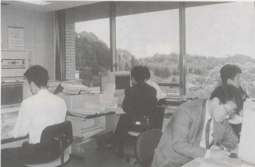
▲情報化社会に対応する情報推進課の電算室