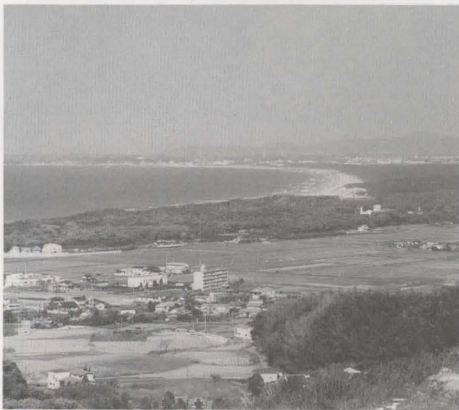
▲福岡県一の規模（450ha）を有する雄大な三里松原