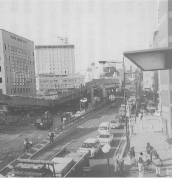
▲阪神大震災で打撃を受けた神戸市中央区

当町に類似している北淡町等を調査した上で検討する。国・県も見直し中なので、今の時点で震度を想定するのは早計であると考え。質問 地方自治と言う観点から、どのように住民の生命・財産を守るのかと思う事を考える必要があると思うがどうか。 答弁 震度七を想定した計画をたてるのが至当ではないかと思っているが、学者の意見や被災地の状況も把握しなければならぬ。