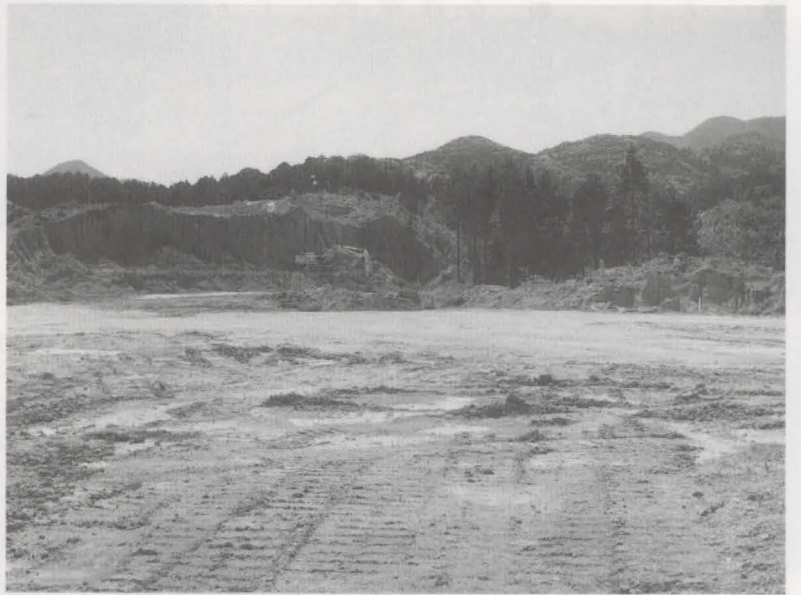
▲造成が進む福祉の里（高倉）