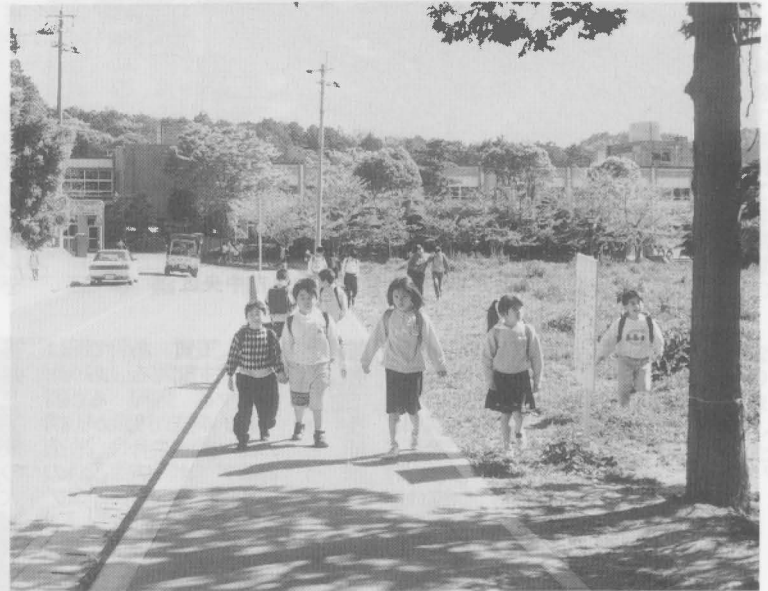
▲小学校の下校風景（みちくさをしないで早く帰ろうよ）

郡内で一番高くなっている。当初見込みより医療費が減ったので一億一千二百万円を基金としてためられており、これを利用して国保税の引下げを求める。