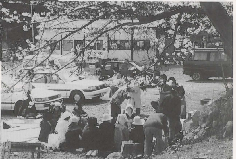
▲桜の花の下で会話がはずむ