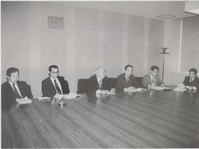
▲総務委員会の審議風景