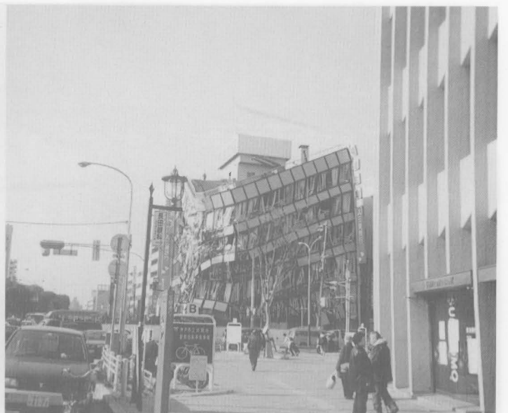
▲阪神大震災で打撃を受けた神戸市長田区