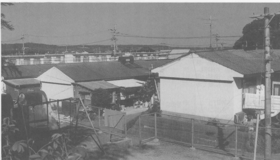
▲町営住宅の風景（三吉団地）