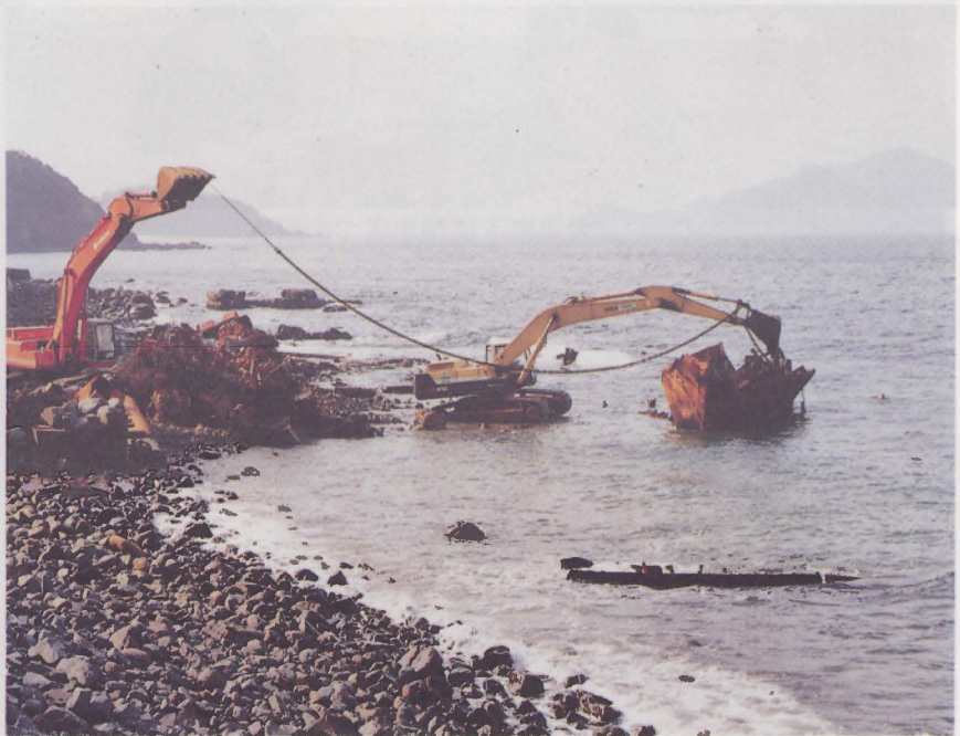
撤去作業でほぼ解体されたマリシー号(12月25日撮影)