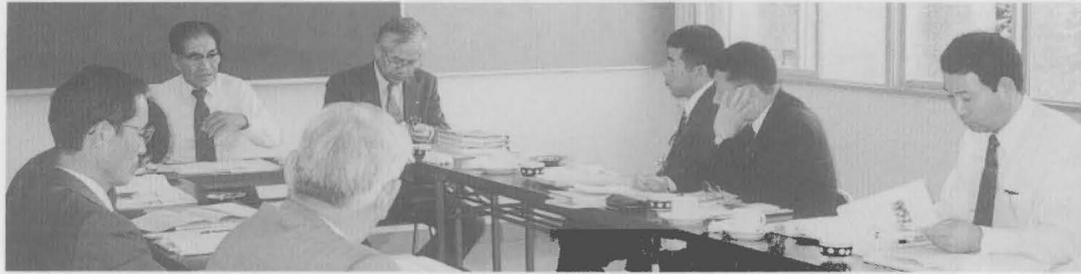
大津市下龍華地区での研修