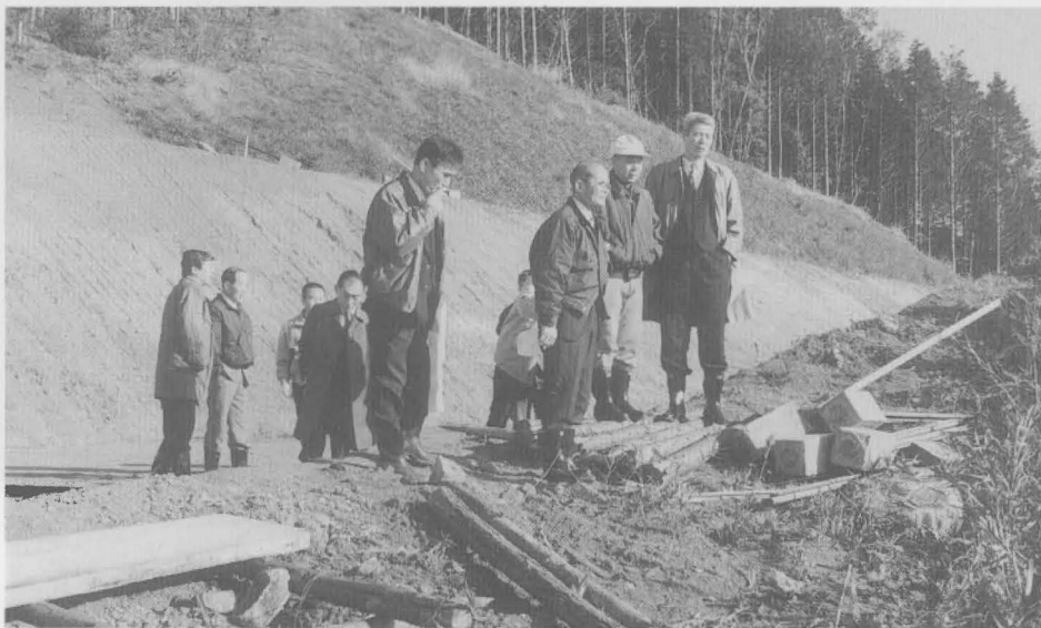
岸元の現地を調査中の委員