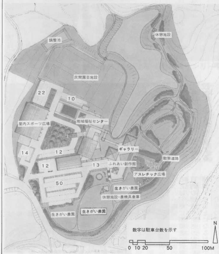
おかがき福祉の里施設配置予定図

答弁 一定期間のなか(3か月)に一回で入札結果を公表したい。入札現場の公開についても、先進地を調査し方法を検討していく。一般競争入札も、検討し取り組む意向を持っている。