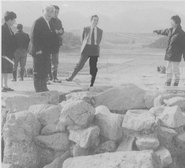
職員から古墳の説明を受ける委員

私たちは、10月14日から16日の3日間の行政視察を行い、町民と同和地区住民が力を合わせ「同和行政」を終結させた、和歌山県吉備町と滋賀県大津市下龍華地区を視察しました。 岡垣町は、平成6年度に「物的事業終結」をめざしています。