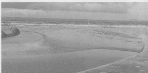
汐入川河口に堆積した砂

同日は堆積する砂の取り扱いが問題となっている矢矧川、汐入川の河口の現地調査も行いました。