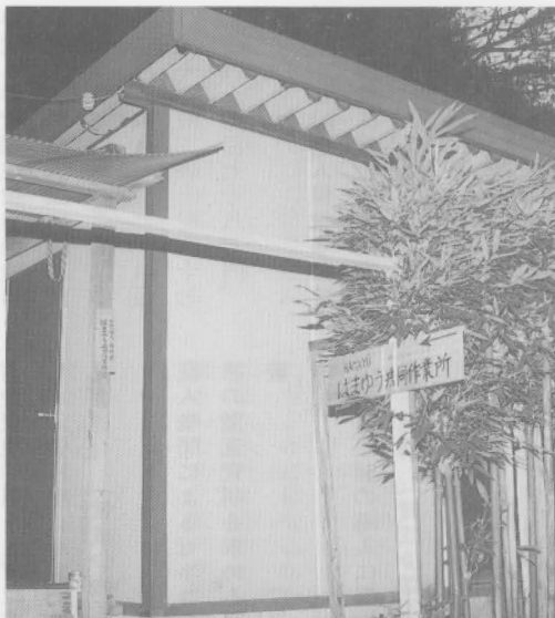
はまゆう共同作業所

答弁 遠賀保健所を交えて四町で協議する。予算編成との関係もあるので結論を早急に出したい。