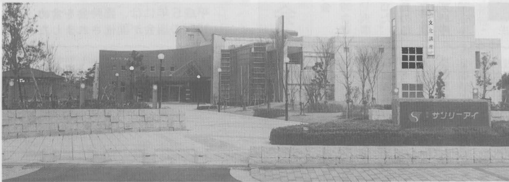
利用者が7万人を越えた岡垣サンリーアイ

（賛成多数認定）平成4年度の町の成果を示したもので、歳入総額九十五億八千六百四十五万円、歳出総額九十二億七千五百五十万円となりました。そのうち三十三