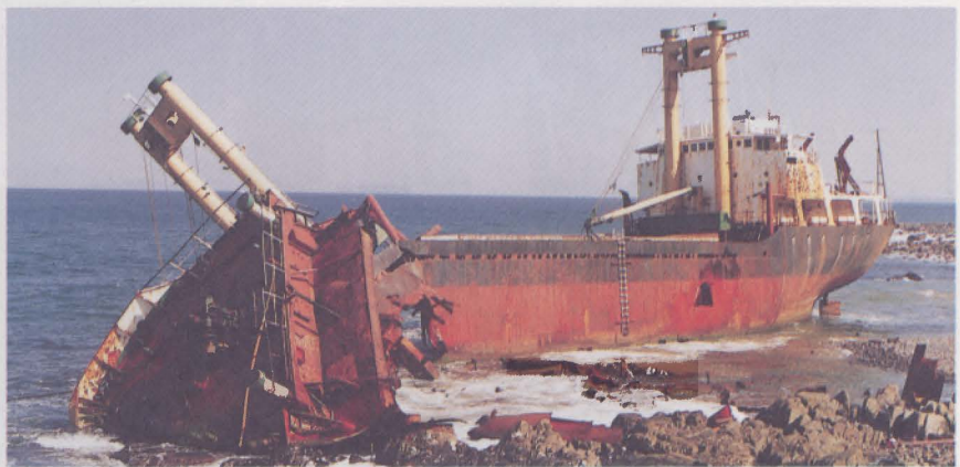
撤去作業前のマリシー号(10月27日撮影)

座礁して2年が経過しようとしていたマリシー号がやっと撤去されました。 波津の漁業関係者に莫大な損害を与え、国や県の関係機関、町の執行部や私たち議会を困惑させ苦惱させたこの貨物船も、大型の作業機械によって、今はもうただの鉄くずと化してしまいました。 急に明るくなった海岸を見たとき、二度とこのような災難が起きないように、また、早く漁場が元の豊かな海に回復するようにと祈るばかりです。