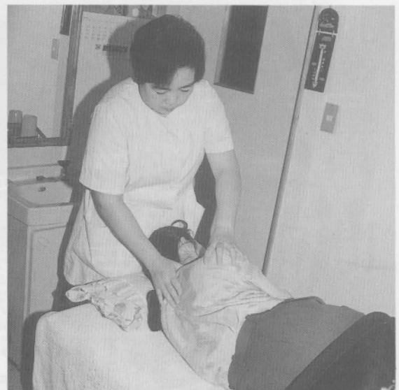
平成7年度から助成開始か

答弁 平成9年度には、地域福祉センターの関連施設である屋内体育施設を建設する計画であり、そこを健康と福祉の増進に活用していただく予定だ。