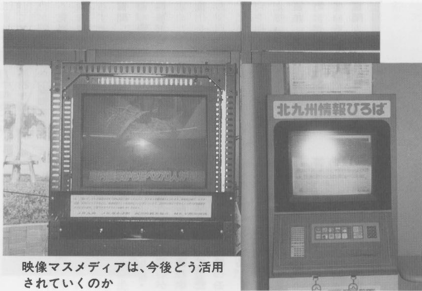
映像マスメディアは、今後どう活用されていくのか