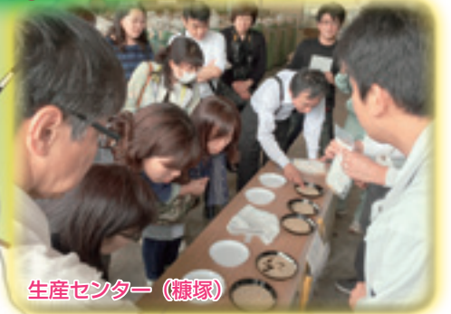
生産センター (糠塚)