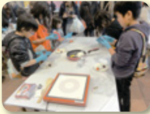
いちご大福作り体験に真剣に取り組む子どもたち