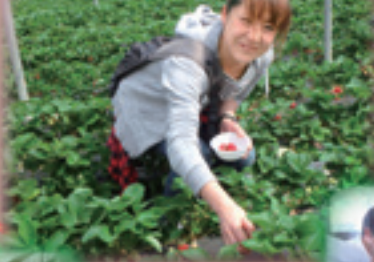
イチゴほ場 (元松原)