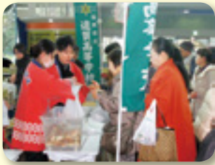
毎年人気の遠賀高校のパウンドケーキ

地域と密着する農業の素晴らしさや食の大切さを伝える各コーナーには、子どもからお年寄りまで多くの方の姿が見られました。中でも、親子おにぎり作りやいちご大福作り体験では、真剣に作っている姿が印象的でした。また、遠賀高校の生徒による地元麦を使ったパンやケーキの販売には、購入者の列ができるほど、賑わっていました。 次回は、12月4日(日)に岡垣サンリーアイで開催されます。