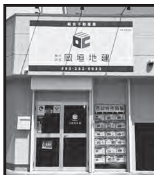
海老津バスのりば横