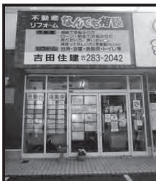
旧3号線沿い茅原信号すぐ側