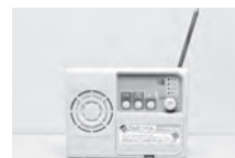
▲「でんたつくん」の戸別受信機