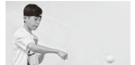
▲手作りのパンチングボールを使ったトレーニングの様子。動体視力を養うことができます

A 毎日ジムで1~2時間ほど縄跳びやパンチの練習をしたあと、1時間以上ランニングを行います。帰宅後も、「パンチングボール」という道具などを使って、自主トレに励んでいます。試合前になると「減量」に取り組みますが、基準を1gでもオーバーすると失格になるため、食事はもちろん、飲む水の量にも気を使います。試合後は、大好きな焼肉を思い切り食べるのが楽しみです。