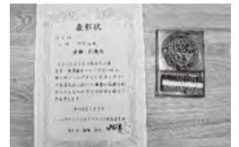
▲JCL全国大会の賞状と銀メダル

A 負けず嫌いなので、次の試合に向けて「絶対勝つ!」という想いで日々を過ごしていて、ボクシングも好きなので、練習はあまり辛く感じません。ただ、やはり試合直前の減量は辛いです。その時は普段より長く練習をして、考える時間を作らないようにしています。