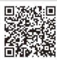
▲税務署での説明会情報