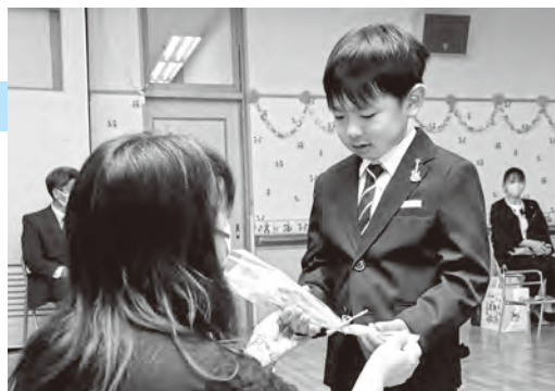
▲花を手渡ししながら保護者に感謝の気持ちを伝える卒園児

子どもたちは、先生や友だちとの別れを惜しみながら、4月からの小学校生活への期待に胸を膨らませ、慣れ親しんだ園を巣立ちました。