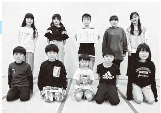
▲今回表彰された「吉木区古小路子ども会」の皆さん