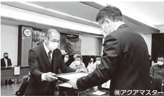
株アクアマスター