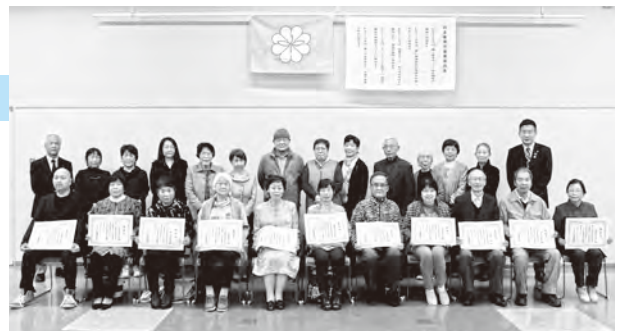
▲今回、民生委員・児童委員を退任された皆さん。長い間、ありがとうございました。

新たに選任された人と引き続き活躍される人の合わせて67人には、町長が委嘱状を交付。今後、地域の人たちが生き生きと元気に、安心して暮らすためのお手伝いをさせていただきます。これからよろしくお願いします。