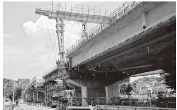
▲完成まで今しばらくお待ちください