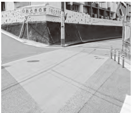
▲カーブミラーなどの設置、カラー舗装後の様子

岡垣第一幼稚園付近の交差点は、通園の時間帯などに多くの人や車が行き交う場所です。今回、園と自治区からの要望により、交差点にカーブミラーやラバーポールを新たに設置したほか、通行時の注意喚起のためにカラー舗装を行いました。これにより、付近を通行する車などの速度抑制につながり、交通事故防止の効果が期待されます。