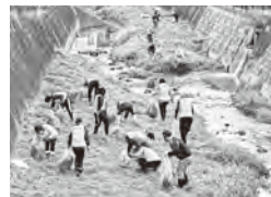
矢矧川清掃活動の様子

初夏にはホタルが飛び交う矢矧川。みんなでごみを拾って、きれいな環境を守りましょう。終了後には、サケの稚魚放流や豚汁の振る舞いもあります。