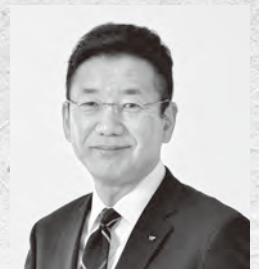
町長 門司 晋

育ててくれた家族や周りの人への感謝の気持ちを忘れずに、自分の行動や言動に責任を持ち、さまざまなことに挑戦して充実した人生を送ってください。今後の皆さんの活躍を期待しています。