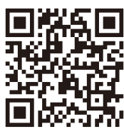
▲町公式ホームページ(職員採用情報)