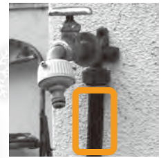
▲露出した管(枠で囲んだ部分)