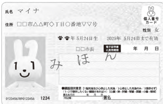
▲マイナンバーカードのイメージ

※本人確認書類は免許証など顔写真付きは1点、健康保険証など顔写真がないものは2点必要 ※必要な書類がないときは問い合わせてください。