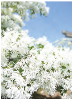
なんじゃもんじゃ・岡湊神社 MAP E-2 【芦屋町】