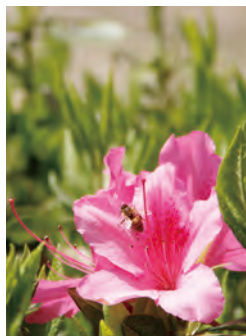
ツツジ・町内全域 MAP B-3 【岡垣町】