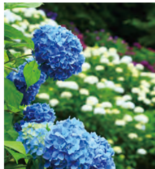
アジサイ・垣生公園 MAP F-5 【中間市】