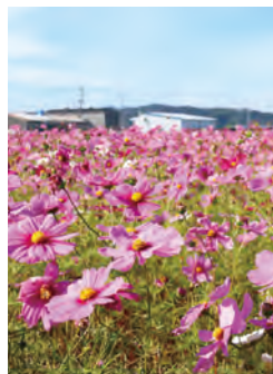
コスモス・若松地区 MAP E-3 【遠賀町】