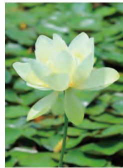
ハス・島津峯ヶ浦池公園 MAP E-2 【遠賀町】