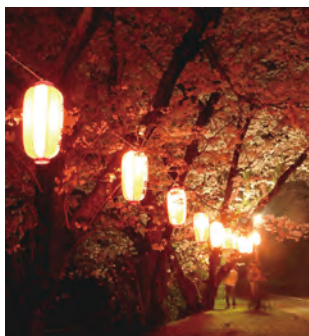
成田山 【岡垣町】 MAP A-3