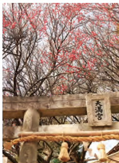
梅・梅安天満宮 MAP F-5 【中間市】