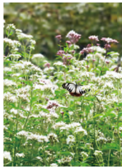
フジバカマ・さとランド小局園 MAP C-5 【岡垣町】