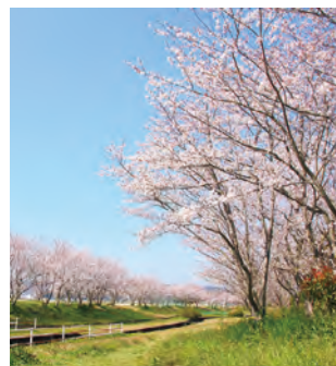
遠賀総合運動公園 【遠賀町】 MAP E-4