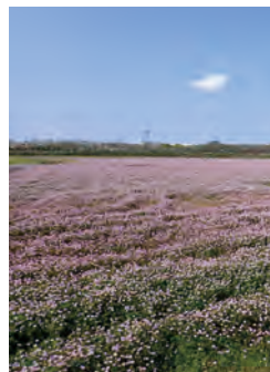
レンゲ・町内全域 MAP E-4 【遠賀町】