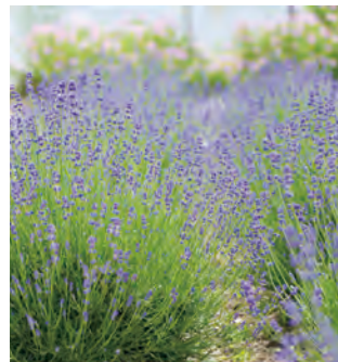
ラベンダー・パルセイユ(株) MAP E-1 【芦屋町】