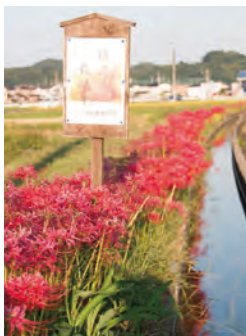
彼岸花・下二西地区 MAP E-4 【水巻町】