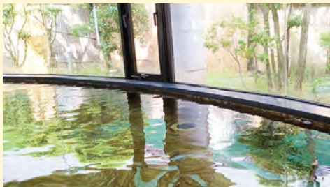
MAP D-4 ふれあいの里【遠賀町】

町の観光情報を案内・発信する施設です。休憩室や温水シャワーなどを備え、レンタサイクルやバーベキューなどが楽しめます。