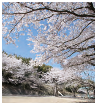
大城公園 【芦屋町】 MAP D-2