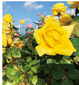
MAP D-1 バラ・ラビアンローズ 【芦屋町】