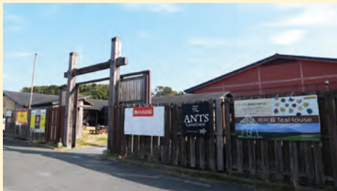
筑前芦屋とと市場【芦屋町】

世界遺産に登録された遠賀川水源地ポンプ室の案内所や歴史民俗資料館があり、中間市の特産品やお土産も購入できます。