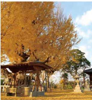
MAP E-4 イチョウ・八剣神社 【水巻町】