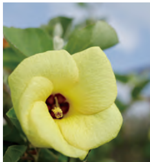
MAP B-2 ハマボウ・汐入川河口 【岡垣町】