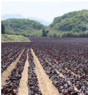
赤シソ・粟屋地区 MAP D-2・3 【芦屋町】