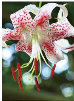
カノコリユリ・月瀬八幡宮 MAP E-5 【中間市】