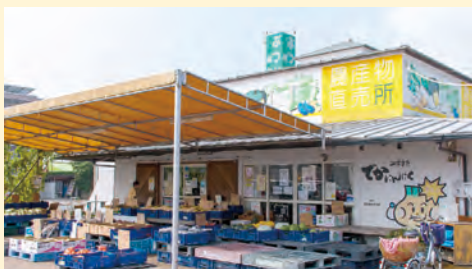
農産物直売所 夢工房【水巻町】

自然の恵みたっぷりの芦屋町から「旬」「安全」「鮮度」にこだわり厳選した品を提供。購入品はその場でバーベキューもできます。