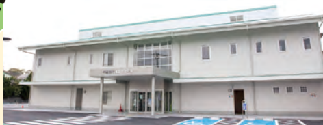
MAP F-5 地域交流センター【中間市】

世界遺産に登録された遠賀川水源地ポンプ室の案内所や歴史民俗資料館があり、中間市の特産品やお土産も購入できます。