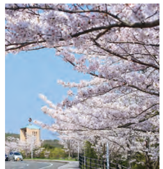
水巻町図書館・歴史資料館 【水巻町】 MAP E-3