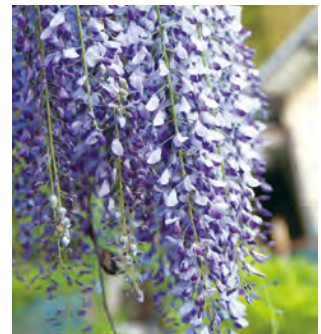
フジ・頃末北地区 MAP E-3 【水巻町】