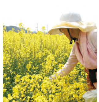
MAP C-3 菜の花・糠塚地区 【岡垣町】