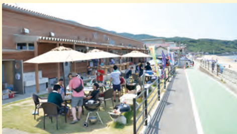
MAP A-2 観光ステーション北斗七星【岡垣町】

高校生が制作した野菜の壁画と黄色・緑色のひさが目印の地元密着型直売施設。特産品「水巻のでかにんにく」やその加工品が購入できます。