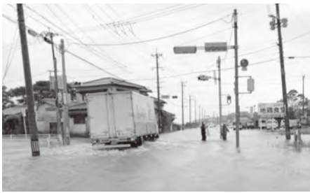
▲昨年度の豪雨による冠水被害※町内

令和元年8月に甚大な被害をもたらした佐賀豪雨災害の被災者や被災地を支援するため、義援金を受け付けます。寄せられた義援金は日本赤十字社を通して、被災地の復興のために活用させていただきます。