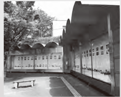
▲駅前ぎやらりーを彩ります