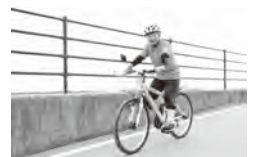
▲今後も長く続けたい

A 膝や腰への負担が少なく、体重の乗せ方次第で全身の筋肉トレーニングになるところです。私はトレーニングのためマウンテンバイクを使っています。また、四季で変化する周りの景色を肌で感じられるところや風を切って走る爽快感、走行中に人がいないところで歌や大声を出すことでストレス発散になっています。