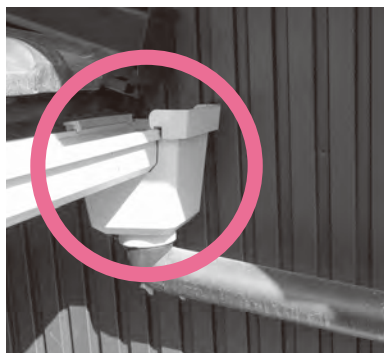
▲雨どいに詰まった落ち葉などは、排水不良の原因になることがあります