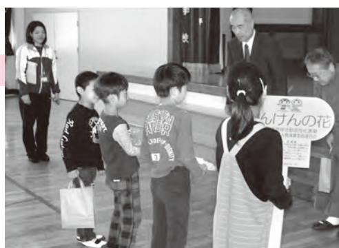
▲人権の花プレートや種を受け取る子どもたち

子どもたちはヒマワリの種を植え、きれいな花が咲くように大切に育てていきます。ヒマワリを育てることを通じて、相手の立場を思いやる心や、命を大切にする心が身に付くことでしょう。