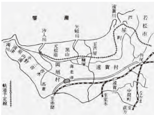
▲八幡市営電車軌道予定図