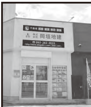
海老津バスのりば横