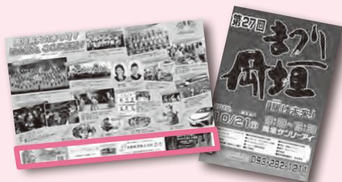
※写真は昨年のチラシ。広告枠は で囲んだ部分

まったり岡垣のチラシに広告を載せませんか 宣伝効果抜群！ チラシは広報おかがきと同時に配布するほか、まったり岡垣の来場者や町内・近隣市の主要施設に配ります。 対象 町内の事業所 募集枠数 4※先着順。審査あり 仕様 1枠40×97ミリメートル、カラー ※掲載場所は実行委員会が指定 費用 1枠5千円 （チラシ） 配布時期 9月25日(水)～10月20日(日) 配布数 約1万8千部 申し込み・問い合わせ 6月25日(火)までにまったり岡垣実行委員会（産業振興課）