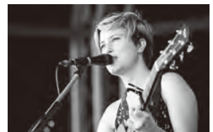
▲提供: Stuart Sevastos

what you were, what you were to me in memory (フリーズドライのバラの花のようにあなたはもう私の記憶の中のあなたには戻れない)で、