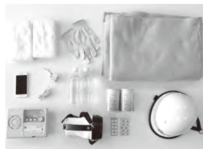
▲非常時の持ち出し品の一例

そのほか、赤ちゃんがいる家庭ではミルクや紙おむつ、母子手帳などがあります。必要に応じて準備してください。