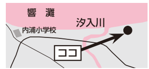
図1 アサギマダラ立寄処