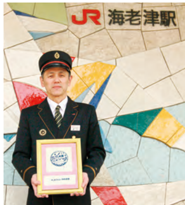
▲限定スタンプの原画を持つJR海老津駅の駅長

岡垣町ふるさと大使で木版画家のえもときよひこさんがデザインした岡垣町限定のスタンプを、町内の施設に設置しました。バリエーションは全部で3種類。施設ごとに違った色とデザインを楽しんでください。 設置場所 JR海老津駅(赤)、岡垣サンリーアイ(緑)、観光ステーション北斗七星(青)