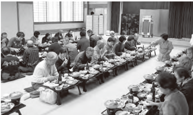
▲日帰り旅行ではおいしい昼食を満喫

平成 29 年 11 月 18 日、シルバー人材センター会員互助会で日帰り旅行に行きました。目的地は嬉野温泉。61 人の会員が参加し、おいしいものを食べ、良質な湯に浸かり、世間話に花を咲かせて楽しみました。