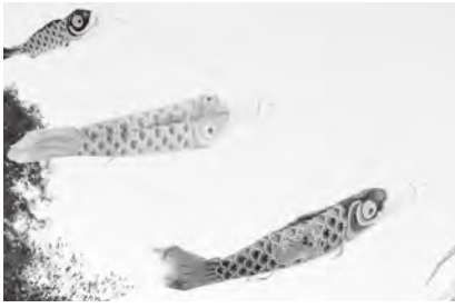
須賀神社に飾ります