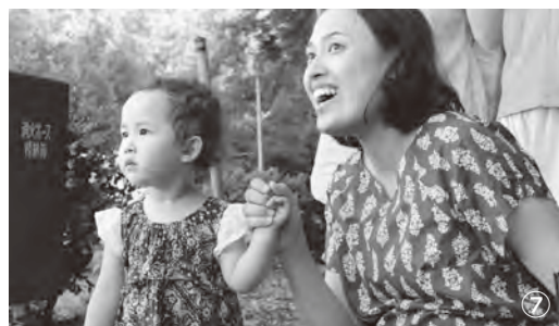
①山林でフジカズラを調達②竹の飾りを作るため竹割り器で竹を裁断③台締めは昔ながらの締め方ですすべて手作業④神輿の飾りは山笠終了後のやま解き後、区内の世帯や企業に配られ1年間の無事を祈って玄関などに飾られる⑤神輿を囲う杉壁作り⑥世間話を楽しみながらの飾り作り⑦大きな神輿にみんな夢中⑧神輿が完成したら無事を祈っておほらいを受ける⑨巖嶋神社入口に掲げられた正道旗