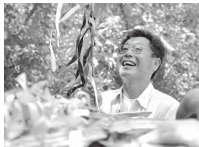
▲神輿の飾り付け。年長者が若者に教えながら華やかな姿へと作り上げていく