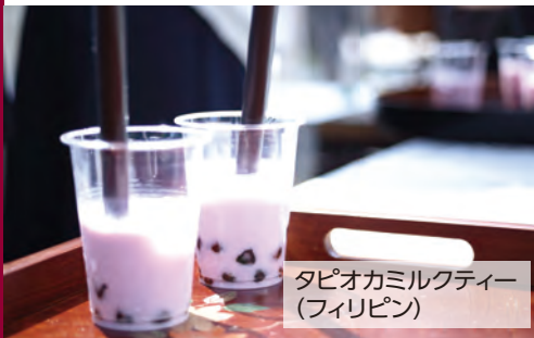
タピオカミルクティー (フィリピン)