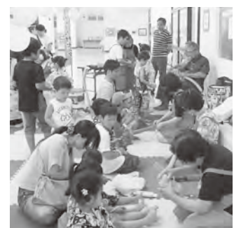
▲昨年行ったなげわ(左)やバルーンアート(右)