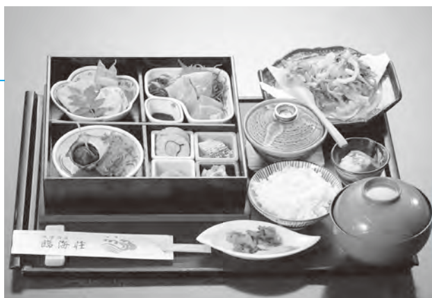
▲昼定食。予約不要で新鮮な料理が楽しめます