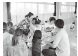
第1回 体験入園のみ親子で・・・