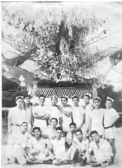
▲昭和25年の東黒山区青年会。現在の同行「黒山会」の先輩や父の世代

山笠が次の世代へと確実に受け継がれている背景には、昔ながらの習慣があります。それは「同行」です。東黒山区では、同年代の男性たちが伊勢神宮にお参りに行き、「同行」という集まりをつくる習慣が古くから続いています。現存する同行は、年齢層の高い順に「黒山会」「若松会」「若鷹会」の3種類。