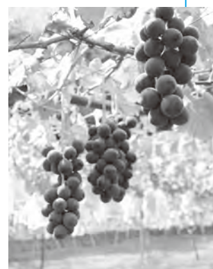
▲漢方巨峰は8月中旬～9月下旬に旬を迎えます