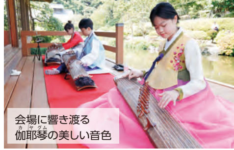
会場に響き渡る 伽耶琴の美しい音色