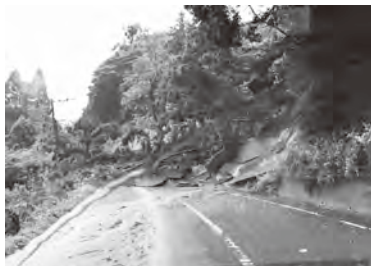
▲岡垣町でも土砂崩れなどが発生

平成30年7月に西日本に甚大な被害をもたらした豪雨災害の被災者や被災地を支援するため、義援金を受け付けます。寄せられた義援金は、日本赤十字社を通じて、被災地の復興のために活用させていただきます。