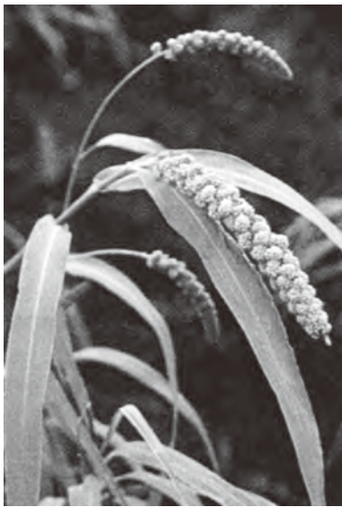
▲粟(太陽コレクション10(平凡社刊)から援用)

る。麦の生産は岡垣で一番多く、琉球芋は糠塚村の次に多かった。出荷販売は海産物が主であった。