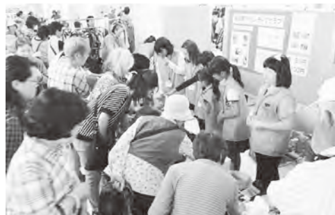
▲ボランティアクラブの出店ブースも大にぎわい

した。また、わたがし作りコーナーは、「自分でつくる」体験が好評で、子どもだけでなく大人も楽しんでいました。