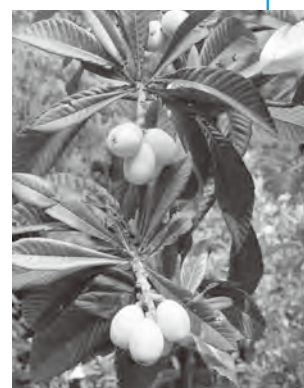
▲高倉びわは7月中旬ごろまで味わえます