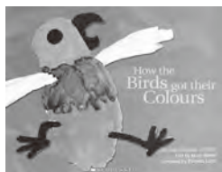
▲有名な絵本「鳥たちは色をどうやってもらった」

一つ目は「鳥たちは色をどうやってもらった」という話です。昔、オーストラリアの鳥たちはみんな黒い色でした。ある日、ハトが足をケガして、ほかの鳥たちが助けに来てくれたとき、足の傷口からたくさんの色が飛び散り、周りの鳥たちにかかりました。その結果鳥たちはカラフルになったのですが、助けに来なかったカラスだけは今でも黒いままなのです。