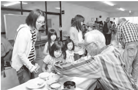
▲子どもも大人もずらりと並ぶ雑貨に興味津々