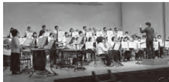
▲年1回の定期演奏会や町内外のイベントで演奏を披露しています

A 岡垣町には、みんなが親しめる文化や団体がたくさんあります。また、小さな町ならではの温かさもあります。ほかの文化団体などとも交流しながら、みんなと一緒に活動を楽しんでいきたいです。