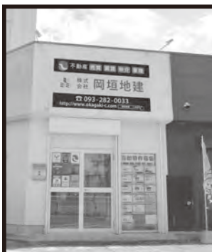
海老津バスのりば横