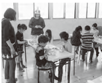
▲4月16日に催したイースター祭も大盛況でした