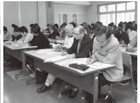
【写真上】岡垣町民生委員児童委員協議会の定例会。会議後の研修を通して、地域の人たちを支えるためのさまざまな知識を身につけている