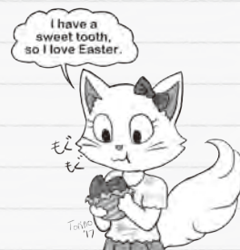
▲甘いものが好きだからイースターが大好き

Sweet toothがある人にとって、イースターやハロウィンなどのお菓子がいっぱいあるイベントは、とても楽しみです。