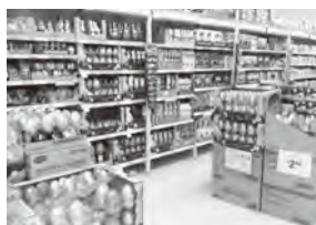
▲スーパーの陳列棚にはチョコレートがぎっしり

イースターはキリスト教の人たちに限ったお祝いではありません。多くの人たちが、春のお祝いとしてイースターチョコレートを食べます。しかし、オーストラリアは秋なので、秋の収穫のお祝いになります。また、オーストラリアのスーパーでは、