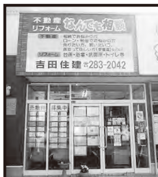
旧3号線沿い茅原信号すぐ側