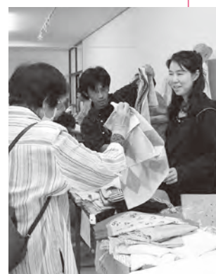
▲フリーマーケットで掘り出しものを探そう