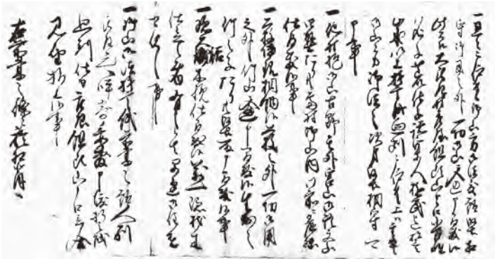
吉田文書の「御山誓紙案文」