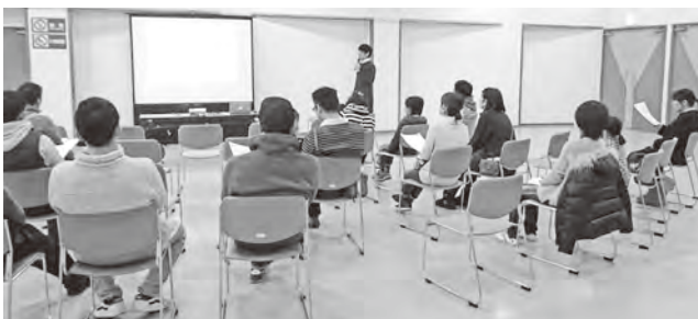
▲イクメンの取り組みなどの話を聞く参加者たち

啓発活動の一環として、今年は2月12日に「ダンボールワークショップ」を行いました。会場となった中央公民館を訪れたのは約30人の親子。講話では、それぞ