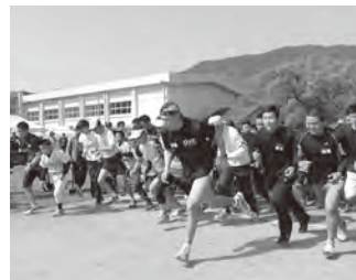
▲日ごろの練習の成果を試してみ ませんか