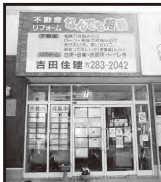
旧 3 号線沿い茅原信号すぐ側