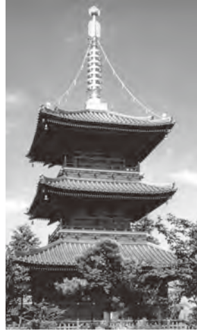
▲豊前国分寺跡内の三重塔