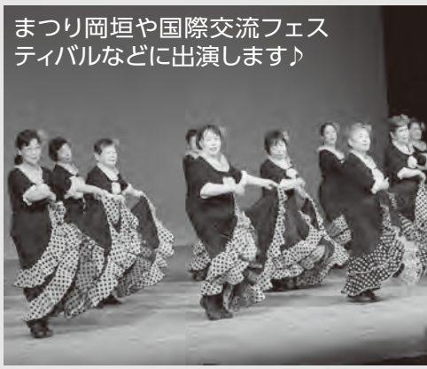
まつり岡垣や国際交流フェスティバルなどに出演します