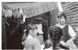
▲まつり当日は大盛況

A 私にとって、大好きな工作を楽しみながら活動できることがとても魅力的です。また、自分たちが作ったもので、まつりに遊びに来た子どもたちが楽しんでくれたので、頑張って準備してよかったと思えました。