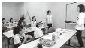
▲みんなで内容を計画