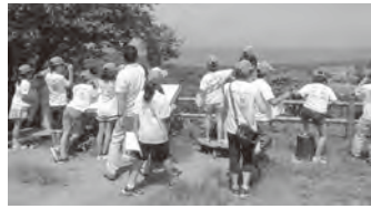
▲2年前に訪れた子どもたち

とき 7月29日(金)～8月3日(水)の5泊6日※ホームステイは3泊 定員 20世帯 申し込み 5月12日(木)までに各学校で配布される申込書を同学校または生涯学習課に提出 問い合わせ 同課へ