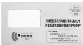
▲対象者に郵送する封筒(紫色)