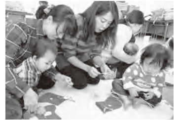
▲親子で楽しめる催しなどを行っている「子育てサークルわらじっこ」