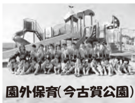
園外保育(今古賀公園)