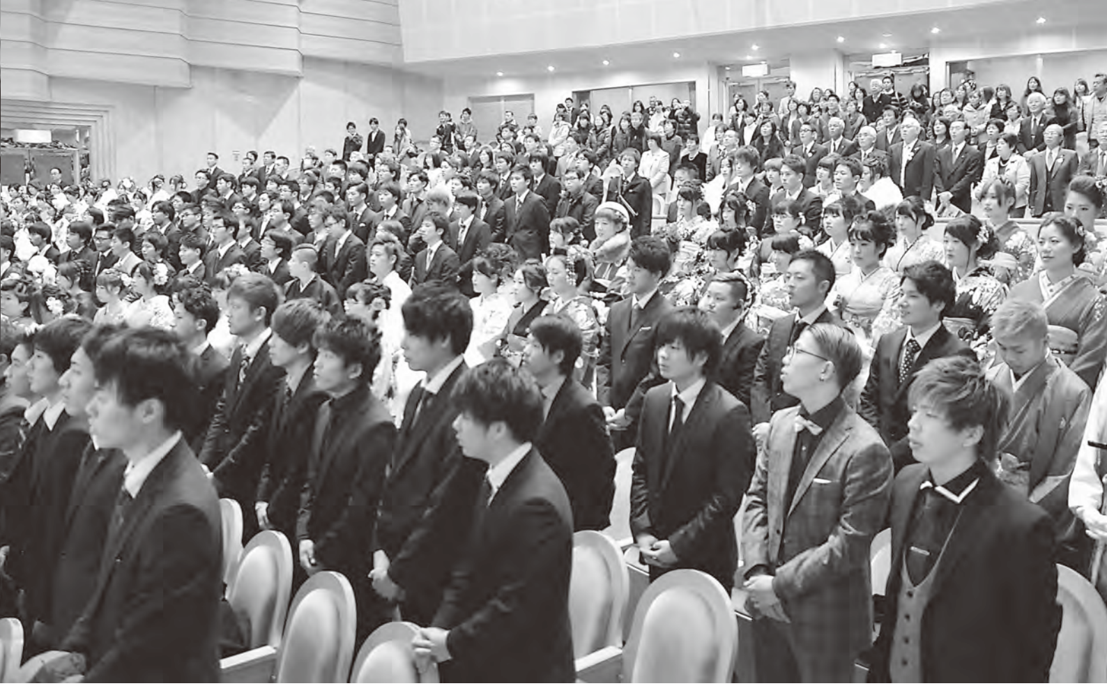
▲大人としてのさまざまな思いを胸に国歌を斉唱する新成人たち