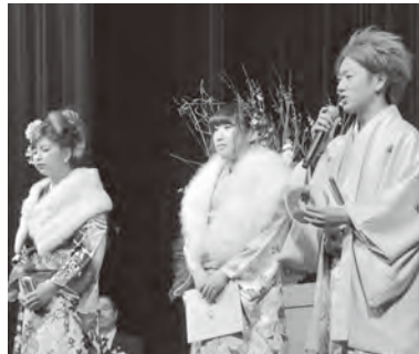
▲引菓子やパンフレットを説明する実行委員の皆さん

に花を咲かせ、昔と変わらず色あせない絆を確かめて合っていました。 彼らは、この日を境に「大人」としての責任を自覚し、夢や希望に向かって歩み始めます。その途中、挫折や困難という壁が現れるかもしれませんが、仲間や恩師と確かめ合った絆を胸に、ともに支え合いながらその壁を乗り越えていくことでしょう。