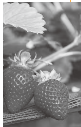
▲イチゴが旬を迎えます