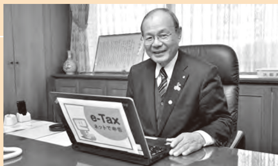
▲宮内町長もe-Taxを利用して申告しています

※e-Taxを利用するには、電子証明書やICカードリーダーライターなどが必要です。詳しくは国税庁ホームページを見てください