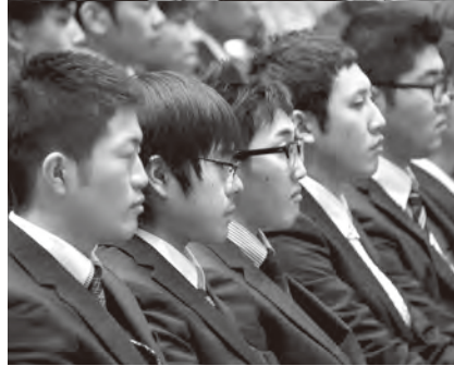
◀来賓のあいさつに耳を傾ける新成人たち。その表情には、大人としての決意が表れていた