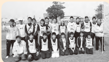
▲選手とスタッフが一丸となって頑張りました

11月22日に市町村対抗福岡駅伝が筑后市広域公園で行われ、岡垣町からは17人の選手が出場しました。岡垣町チームはユニフォームを新調し気合十分。序盤から好タイムでレースを続け、最終順位は35位と昨年の53位から大躍進を遂げました。出場した選手からは「中学生からシニアまで幅広い世代の仲間と親睦を深めることができました」という声が聞かれました。