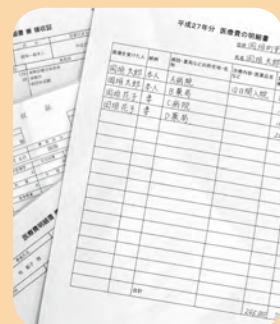
▲医療費の明細書は人別・病院別にまとめてください