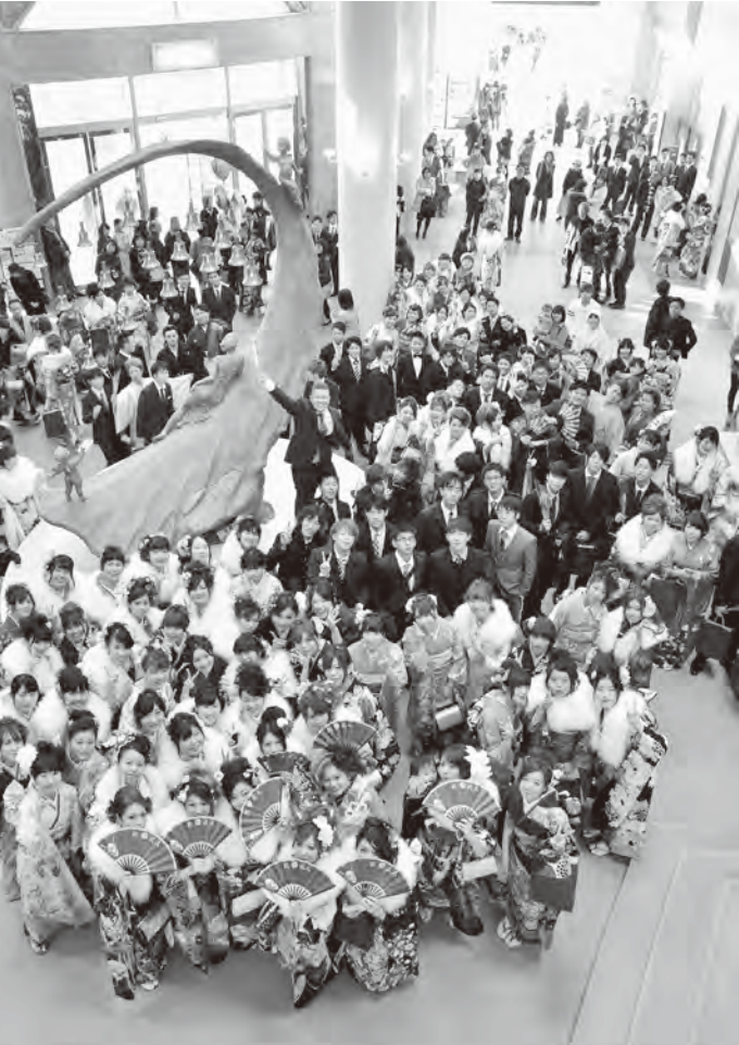
▲美しい振り袖や真新しいスーツに身を包む新成人たち。彼らの晴れ姿を一目見ようと、多くの保護者も会場に集まった