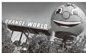
▲ Mildura市にあるオレンジワールド

問題は、ビクトリア州内に見る価値のあるものがほとんどないことです。例えば、私の初めての州内旅行は小学生のころに2泊3日で行ったビクトリア州のてっぺんにあるミ