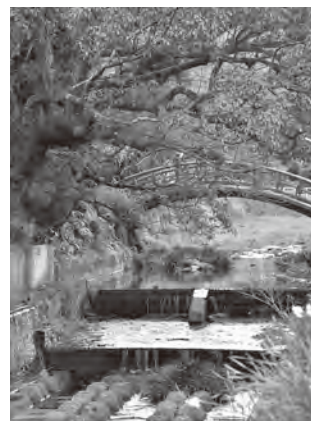
▲高倉神社沿いを流れる乳垂川

小手は籠手とも書き、鎧をまとったときに、肩先から左右の腕を覆う武具である。この小手を手野で休息されたとき、ここに置かれて、そのまま出立されたので、この地を小手の村と言ったのを、後世に小の字を取り、手野村としたと言っている。