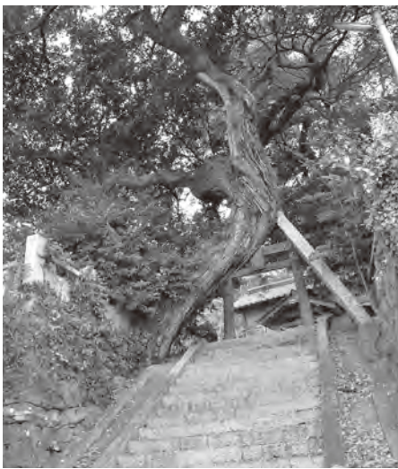
▲神功皇后を祀る波津の大歳神社

まず「波津」である。『福岡県地理全誌』には「古八初トカケリ。村ノ名義ハ、昔、神功皇后御旗