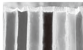
▲オーストラリアのアイスクャンディー