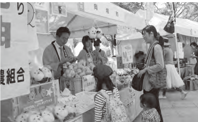
▲各イベントであなたの商品をPR!

岡垣町観光協会では、私たちと一緒に町観光振興に協力してくれる会員を募集しています。会員になってもらえば、観光協会のホームページやさまざまなイベントなどで、皆さんの商品やサービスのPR・