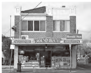
▲オーストラリアのビクトリア州にあるミルクバー

ミルクバーは、大きな窓に広告がたくさん貼られていて、いつも涼しく、夏の暑い日に最適な空間でした。カウンターに並ぶチョコレートやポテトチップ、10セントの激安飴。そして、私を待っているアイスクャン