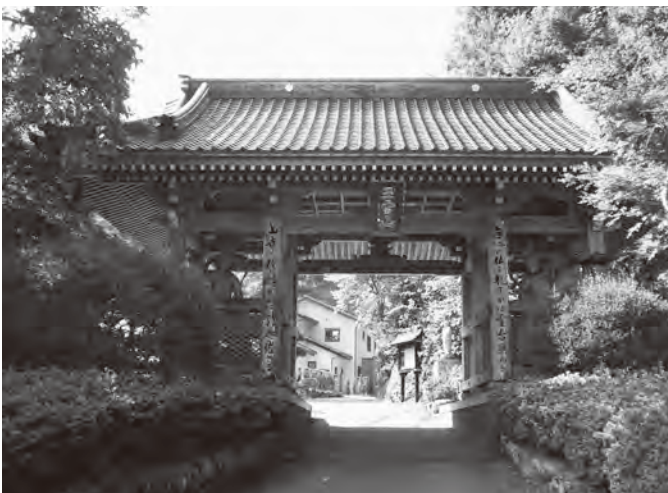
▲井上周防(九郎右衛門)の菩提寺龍昌寺の山門

さえたら加藤清正とともに関門海峡を渡り、広島を攻めるとしている。また、清正と如水が西軍から奪取した所領が2人に押領されるよう家康への口利きを要請。さらに、黒田長政には関東での領地押領を願い、如水とは別々の家として領地押領を望む旨記されている。これは、東西対立の中、全国で起きた領地拡張競争と同じである。官兵衛の最後の輝きは、秀吉とともに駆けた戦国時代の再来だったのであろう。