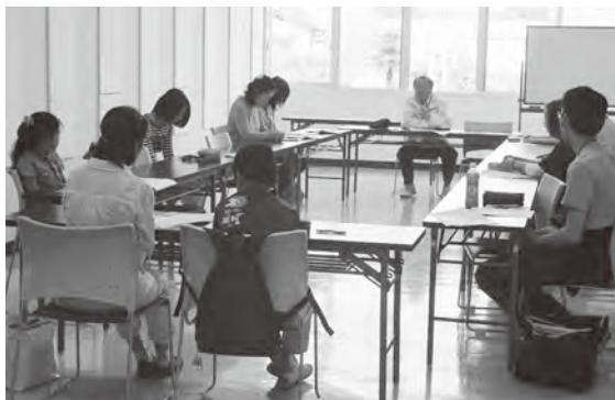
▲ボランティア説明会の様子