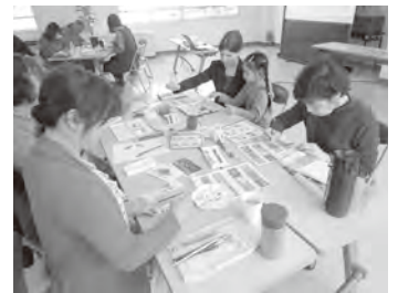
▲色鮮やかな水彩画を描きました