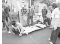
▲旭南区の防災訓練

いざというときのために一人ひとりが自主防災組織の必要性を理解し、積極的に活動して災害に強い地域をつくりましょう。