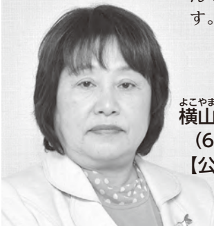
よこやま たかこ 横山 貴子 (60歳) 【公明党】

女性のきめ細やかな視点で、「一人の人を大切に、一人の声を大切に」をモットーに、行動力と対話力を発揮して、だれもが安心して笑顔で暮らせる町、活力と魅力あふれる町へ、さらに全力で取り組んで参ります。