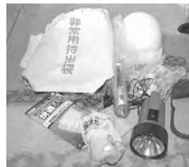
▲非常用持出袋と中身

災害は実際に経験しないとその恐ろしさがわかりません。岡垣町では大きな災害は起きないだろうと過信せず、日ごろから危機感を持ってほしいと思います。私自身、今後も万が一に備え、最低限の準備を続けていきたいと思っています。