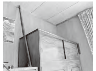
▲タンスの転倒防止補強

一時的に停止しても生活できるように、最低でも3〜5日分程度の準備をしておく和良好的でしょう。高齢者や子ども、アレルギー体質の人は、避難所での配給食を食べられないこともあります。安心して食べられるように、家族に合わせた非常食を準備しましょう。