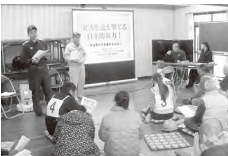
▲戸切白谷区の講習会の様子

災害が起きたとき、スムーズに対応するためには防災訓練などを定期的に行い、一人ひとりの災害への意識を定着、向上させることが大切です。そのためには、今後どのように防災活動を進めていくかが課題となります。初めから大災害を想定した大がかりな訓練はできませんが、小さなグループで訓練を行うなど、区の中でできることから取り組んでいきたいと思っています。