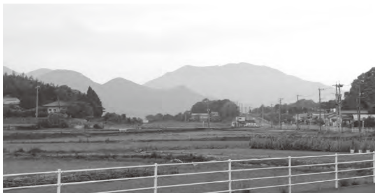
▲西黒山春日神社から望める湯川山

蹄の跡がついたと言う。この直径1メートルの大石が、湯川の牧神社の境内に鎮座している。牧場跡には、いまも牧があつたころの濠や囲い土手などが残り、また湯川の海辺の黒崎ノ鼻には、海に面した断崖に、「摺墨」が秣として食べたという草があり、名馬草と呼ばれている。