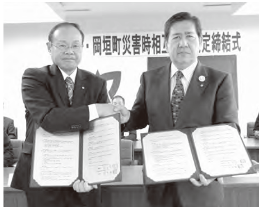
▲津幡町・岡垣町災害時相互応援協定締結式の様子