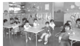
《お友達一杯できたよ!》