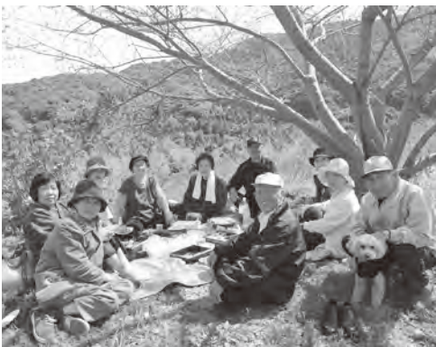
▲花がなくても団子を満喫!?