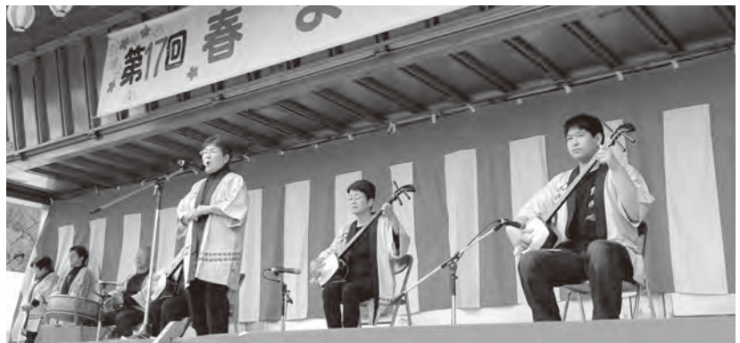
▲多くの人たちが日ごろの練習の成果を披露