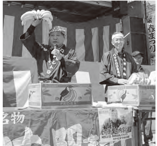
▲大盛り上がり！バナナの叩き売り