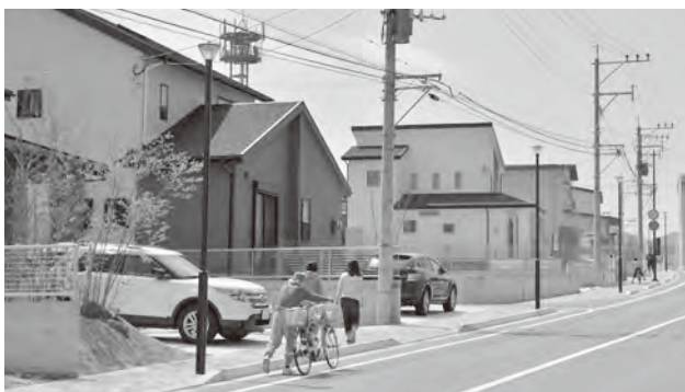
定住促進対策事業

平成 26 年度から本格的な取り組みを始めた定住促進事業について、特に町外に向けたさらなる情報発信が必要です。そこで、全国誌への特集記事の掲載など、プロモーション活動を行い、流入人口の増加、空き家対策を積極的に推進します。