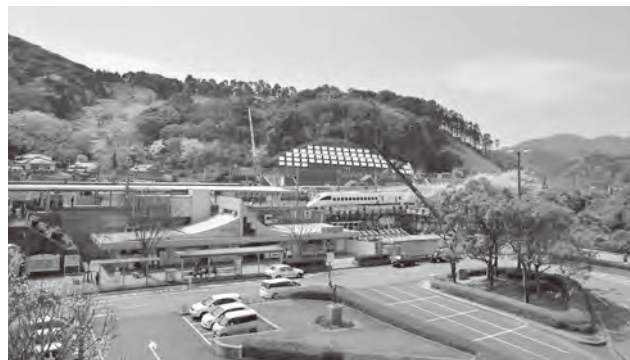
海老津駅周辺環境プロジェクト

多くの住民の交流・にぎわい創出に向けて、ブックカフェ機能を追加し、管理運営を新たに指定管理者に委託して、4月2日にリニューアルオープンしました。