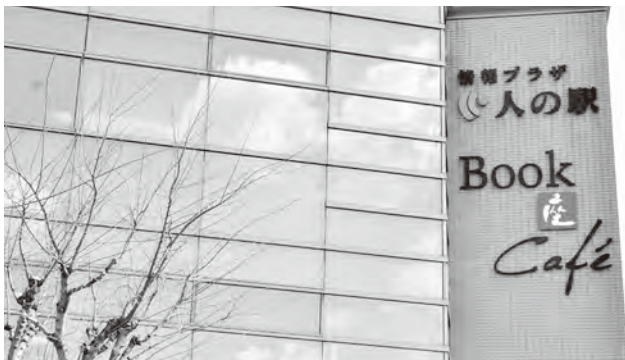
情報プラザ人の駅の管理運営

多くの住民の交流・にぎわい創出に向けて、ブックカフェ機能を追加し、管理運営を新たに指定管理者に委託して、4月2日にリニューアルオープンしました。