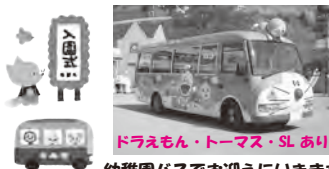
ドラえもん・トーマス・SLあり 幼稚園バスでお迎えにいきます!