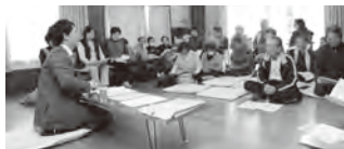
▲龍王団地区での出前講座の様子

町では、認知症を正しく理解し、近所で身近な応援者となる「認知症サポーター」を養成するために、地域や職場、学校などへ講師を派遣し、出前講座を行っています。皆さんも認知症サポーターになり、地域で認知症の人やその家族を支えていきましょう。