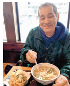
▲30年ぶりに定食を味わう父

「全てが経験なので、その大切さはかけがえがない」と両親はいつも言っていました。「行ってみたいと分からない、やってみないと分からない」皆さんも、簡単なことから第一歩を踏み出してみませんか？