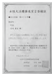
▲交付された登録証